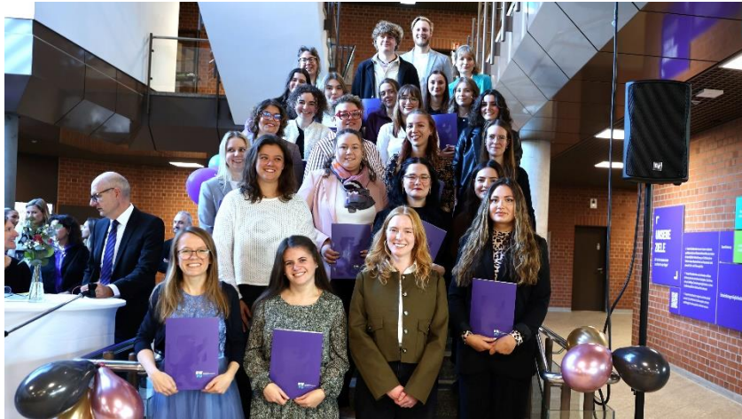
Die Absolvent*innen des Studiengangs Soziale Arbeit.