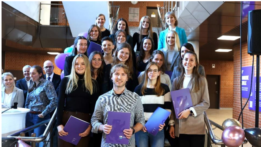
Die Absolvent*innen des Studiengangs Angewandte Psychologie.